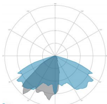
ÓPTICAS: 7-ASIMÉTRICA VIAL