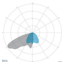
ÓPTICAS: 8-ASIMÉTRICA SPORT +