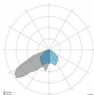
OTTICA: 1-ASIMMETRICA SPORT