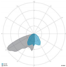
OTTICA: 8-ASIMMETRICA SPORT +