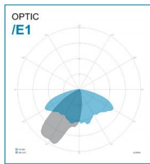
OTTICA: E1-STRADE MEDIE